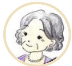
Tu (lo studente)