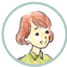
Il tuo amico (l'insegnante)